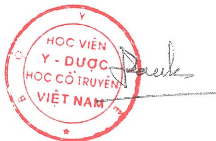
Đậu Xuân Cảnh